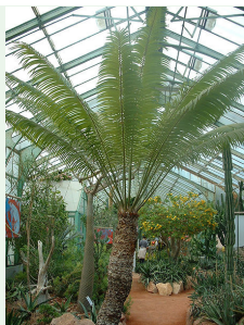
Cycas thourarsii inscrit à l'Annexe II de la CITES

◆ Nom : Cycas de Madagascar ; Madagascar cycad ( Cycas thourarsii )