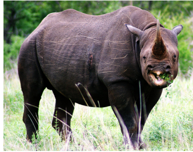
Rhinocéros noir ( Diceros bicornis longipes ) inscrit à l'Annexe I de la CITES

L'annonce de l'extinction du rhinocéros noir d'Afrique de l'ouest est intervenue quelques jours avant la saisie record à Hong Kong de 33 cornes de rhinocéros illicites dissimulées dans un convoi provenant d'Afrique du Sud.