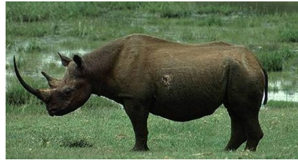
Rhinocéros noir d'Afrique de l'ouest ( Diceros bicornis longipes ), Annexe I de la CITES

Le Bureau Régional du Species Survival Network (SSN) en Afrique vous invite à découvrir ce dernier numéro de CITES Afrique pour l'année 2011. Ce numéro examine le défi difficile que le commerce illicite des espèces sauvages représente pour les Parties à la CITES. Il donne également des informations très préoccupantes sur l'extinction du rhinocéros noir d'Afrique de l'ouest ( Diceros bicornis longipes ) et la quasi-extinction du rhinocéros blanc du nord ( Ceratotherium simum cot-