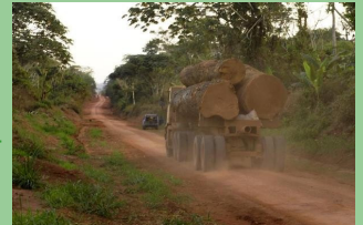
Camion transportant du bois sur la route de Siforco

Le teck d'Afrique ( Pericopsis elata ), un bois tropical très précieux inscrit à l'Annexe II de la CITES, est exploité en RDC. Près de 40 millions de personnes dans le pays dépendent de la forêt tropicale pour leurs besoins de subsistance dont les médicaments, la nourriture ou le logement. Le Bureau de Greenpeace en Afrique a lancé une initiative pour sensibiliser et mobiliser la jeunesse congolaise pour préserver leurs forêts très précieuses. Des militants et des volontaires de Greenpeace ont visité des écoles pour faire de la sensibilisation à Oshwe dans la province de Bandudu, et à Kinshasa, la capitale du pays. La campagne a été lancée par un concours de poésie intitulée « L'avenir des forêts en poésie » encourageant les écoliers et les étudiants de la RDC à écrire des poèmes sur les forêts qui les entourent. 2600 poèmes ont été écrits lançant des messages fermes aux gouvernements, aux décideurs politiques et aux donateurs sur l'importance de la sauvegarde de ces forêts.