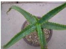
Aloe schweinfurthii inscrite à l'Annexe II de la CITES