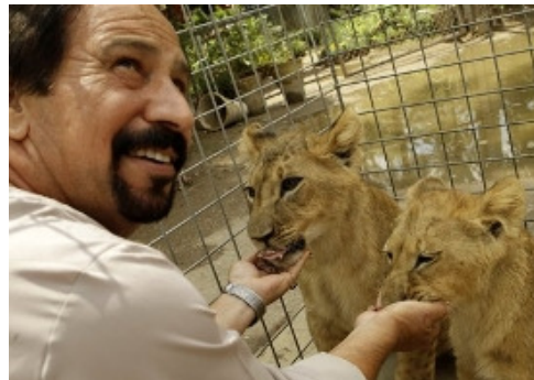
Lions africains disponibles à la vente pour un prix de 6000 USD chacun à Baghdad, Irak