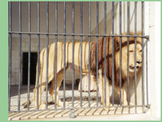
Lion ( Panthera leo ) gardé dans un zoo européen ©

Eurogroup for Animals , avec l'appui de ses membres, a conçu une stratégie pour les animaux confisqués qui aidera les Etats membres de l'UE à traiter des confiscations des animaux vivants d'espèces CITES qui sont commercialisés illégalement. La stratégie a été partagée avec les autorités compétentes pour promouvoir les efforts des Etats-membres de l'UE à adopter leurs propres stratégies et à faciliter le travail de la douane, de la police et des autres autorités impliquées dans la confiscation des animaux vivants. Eurogroup a également mené des investigations sur les lois nationales concernant le commerce et la garde des animaux exotiques en tant qu'animaux de compagnie et a conclu que les niveaux de protection et les espèces couvertes variaient considérablement entre les Etats membres de l'UE. Eurogroup promeut l'utilisation d'une liste positive qui énumère de façon concise les espèces dont la garde est autorisée plutôt que des listes d'espèces interdites très longues dont la révision fréquente est nécessaire. Eurogroup travaille avec ses membres pour promouvoir l'utilisation de listes positives dans les pays clés tout en identifiant d'autres opportunités pour traiter de la garde privée des animaux exotiques par le biais de la sensibilisation, de la lutte contre la fraude et des restrictions sanitaires.